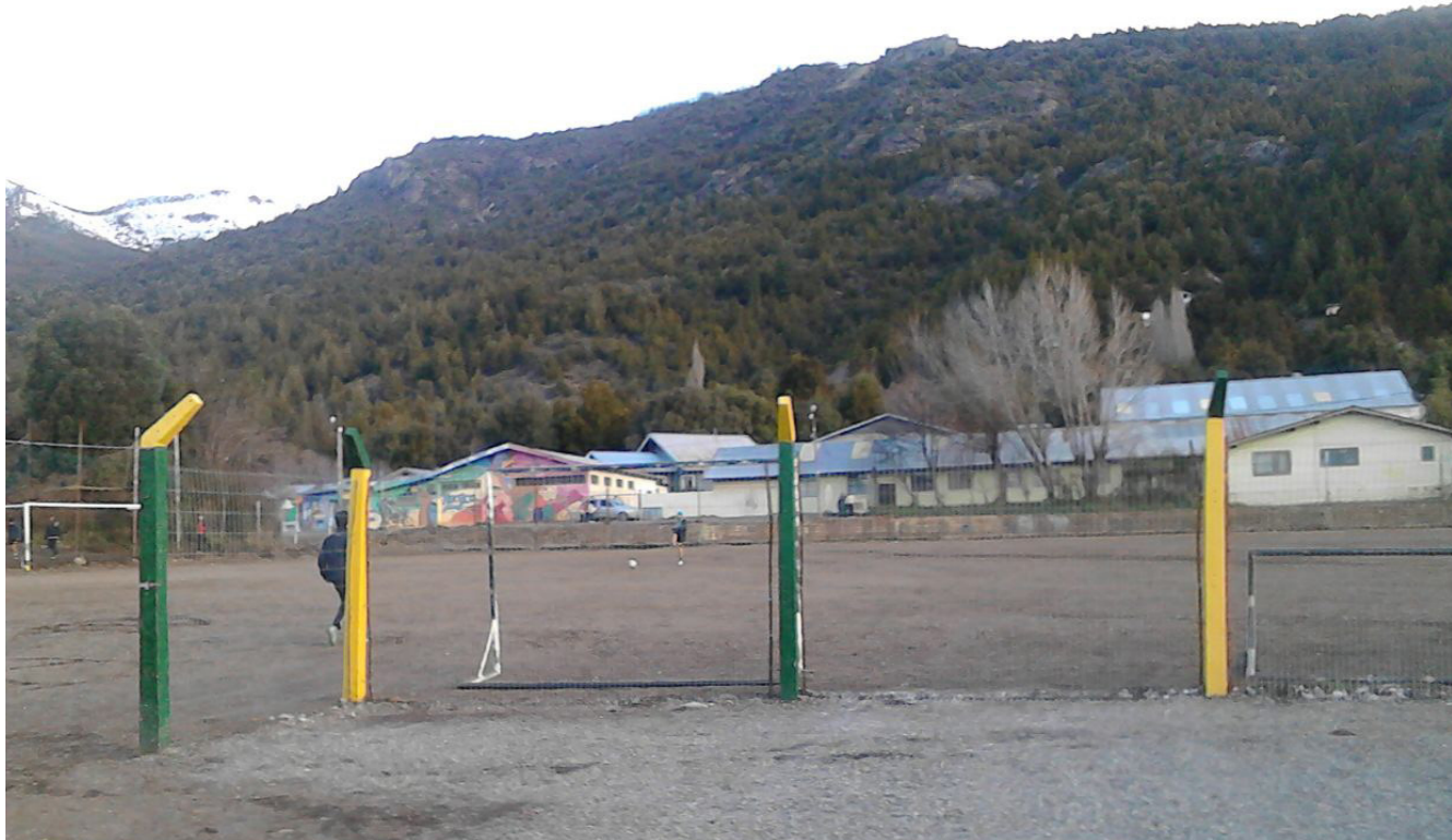
Cancha de “fútbol 11” del club “Arco Iris”.