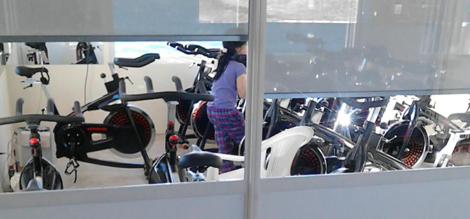
Sala de aparatos y bicicletas fijas en “Vuriclub”.

procesos de reflexividad tendientes a una diferenciación e interacción discursiva con los sujetos implicados en la investigación (Guber, 1991). Las teorías y las metodologías utilizadas, a la vez que oficiaron como referencias ineludibles para el análisis, fueron ordenadas y modificadas según las perspectivas de los agentes, buscando captar las evidencias discontinuas, incompletas y parciales de las prácticas, en sus enlaces con los condicionamientos socioculturales y políticos (Bourdieu, 2007). A lo largo de la investigación se triangularon los datos construidos a partir de las entrevistas en profundidad, las observaciones de clases y el análisis de documentos, con el fin de suplir las carencias que cada una de estas técnicas presenta de forma aislada. El estudio se ha complementado con técnicas estandarizadas que responden al modelo cuantitativo, las cuales aportaron datos adicionales de sumo interés.