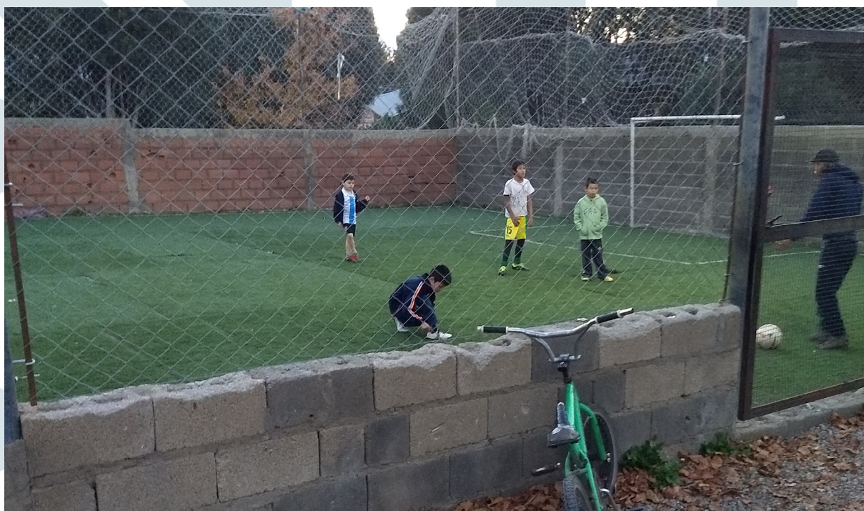
Instalaciones del club “Arco Iris”, cancha de “fútbol 5”.

La enseñanza del fútbol en las dos asociaciones manifiesta “híbridos masculinos” (Archetti, 2003:48), siendo los estereotipos machistas parte de sus manifestaciones marginales. Las concepciones hegemónicas reafirman estereotipos tradicionales socialmente más aceptados, con una mayor apertura hacia las masculinidades múltiples, sin embargo, existe una tendencia a sostener los imperativos sexistas que fijan las limitaciones de acceso para el género femenino. Asimismo, se observa que dichas concepciones operan conjuntamente como una fuente de construcción de significaciones sociales donde los niños, los jóvenes y los socios pueden reconocerse dentro de una comunidad de pertenencia.