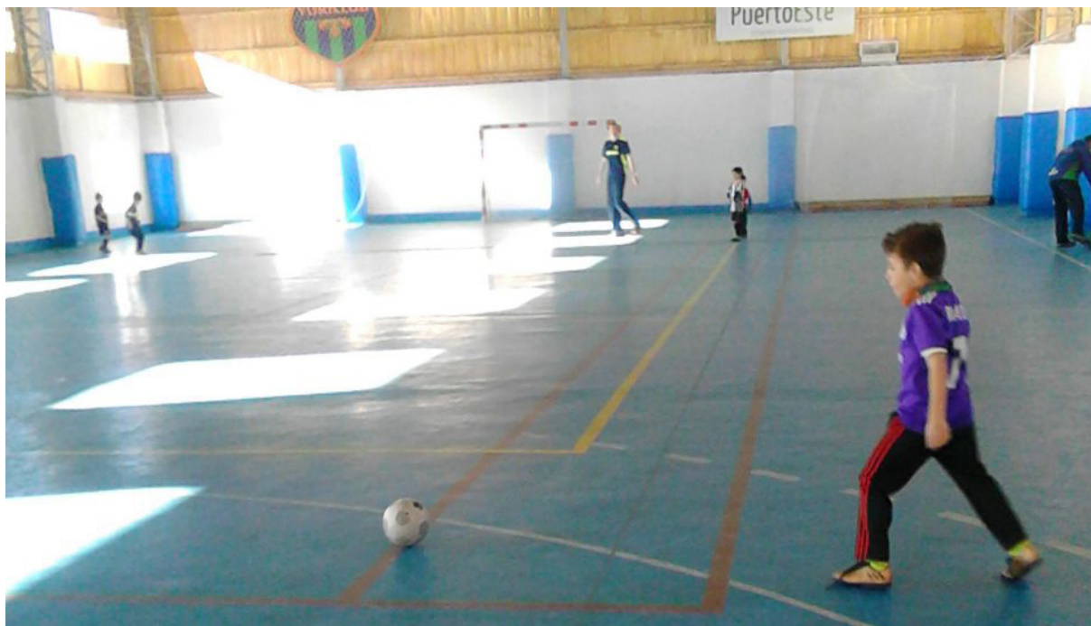
Instalaciones del "Vuriclub". Cancha de "fútbol 5".