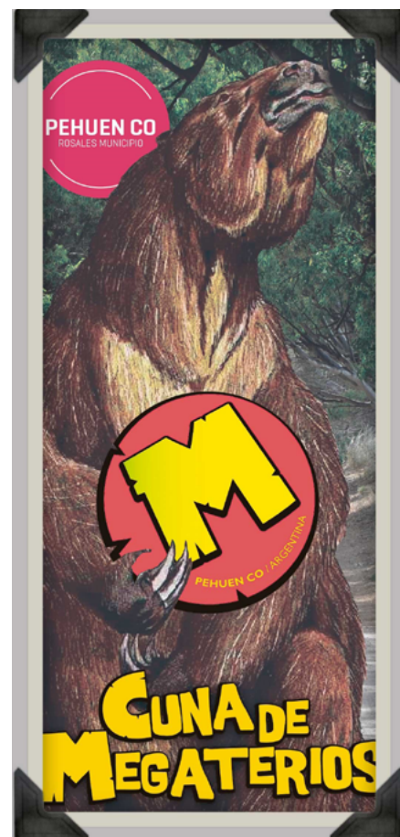
Figura 3. Marca turística “Pehuen Co: Cuna de Megaterios”.

En relación con los conflictos de uso turístico en el espacio integrado por la reserva, como consecuencia de reiterados incumplimientos de la Ordenanza Municipal N° 1668/1986 que prohíbe la extracción y destrucción de restos fósiles en la jurisdicción del Partido de Cnel. Rosales, el Organismo Provincial para el Desarrollo Sostenible (OPDS) decidió cerrar el tránsito vehicular por