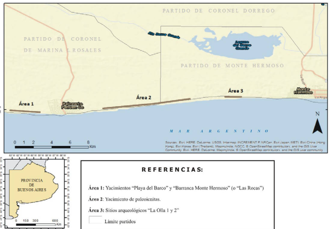
Figura 2. Reserva Natural Provincial "Pehuen Co-Monte Hermoso".