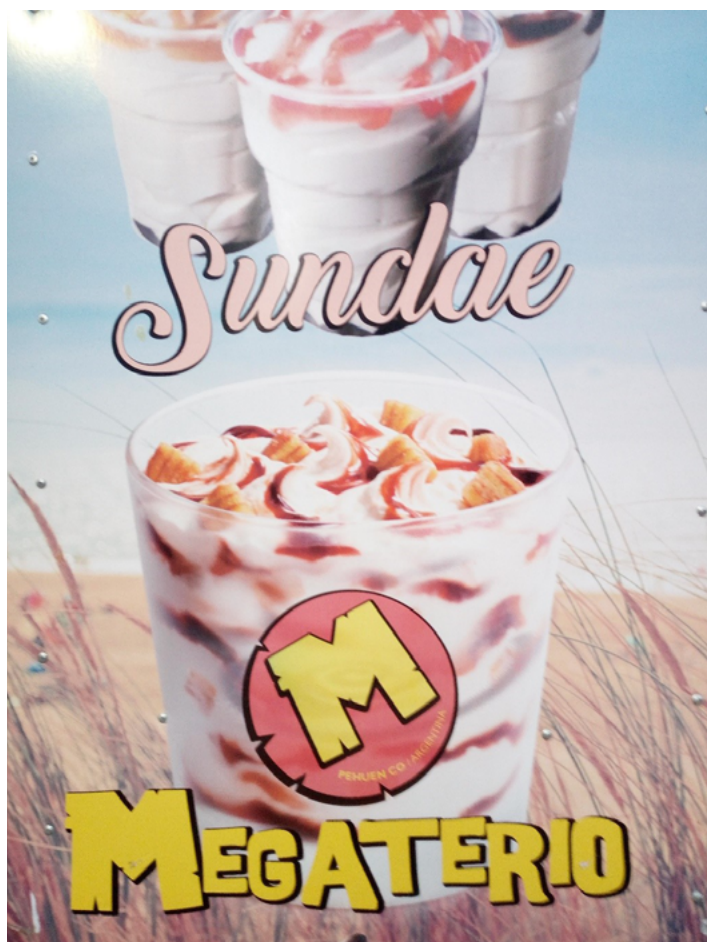
Figura 4. Utilización comercial de marca “Pehuen Co: Cuna de Megaterios”.

Con relación al proceso de valorización, la siguiente Tabla sintetiza las principales acciones que afectan al proceso, la escala gubernamental en la que se producen, los actores involucrados, y los instrumentos por los que se realizan (Tab. 1).