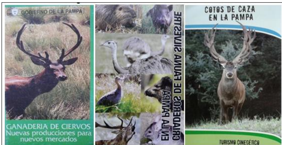
Figura 2. Promoción de la actividad “no tradicional”.

De acuerdo con la perspectiva de los dueños de coto de caza “está bien organizada” la legislación de La Pampa, pero falta promocionarla: “es la actividad que genera turismo en la provincia, la única que genera turismo genuino, no de paso, que deja dinero acá pero no le dan la atención que tendría que tener” (propietario de coto Categoría A, Utracán, junio de 2017).