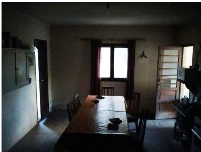
Figura 5. Interior de vivienda para recibir turistas.

En este tipo de establecimientos la generación de redes tiene un alcance local-regional y eventualmente se articulan con redes internacionales, de modo que suponen un nivel de artificialización del espacio mucho menor que en los cotos cerrados. Difunden su servicio de “boca a boca” y través del tendido de vínculos familiares y vecinales. También utilizan las redes sociales y páginas web gratuitas para ofrecer su coto, pero algunos “seleccionan” a los cazadores y priorizan a los conocidos.