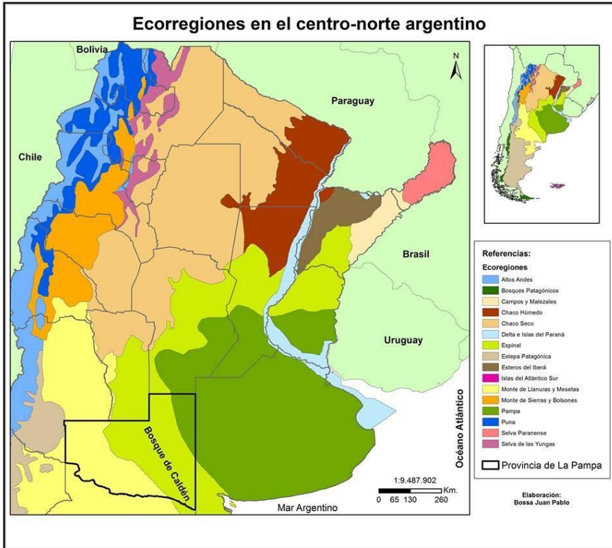
Figura 1. Ecorregiones que atraviesan La Provincia de La Pampa.

Aparecen nuevas lógicas productivas y las dinámicas territoriales a distintas escalas. Diversas formas de dominio y apropiación del espacio se ponen a la luz, y a menudo, entran en tensión (Comerci, 2015).