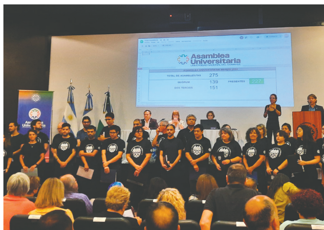
Imagen: R. Vega.

1 Decano del Centro Regional Universitario Bariloche, Universidad Nacional del Comahue, Río Negro, Argentina.