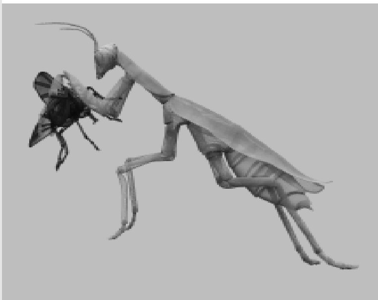
Mantis religiosa. Parece que reza / Decapita su presa. 2004. 180 x 230 x 70 cm. Tela metálica.

Roca 1996 y 1997, Bosque Tallado, El Bolsón 1998 y 1999 y Esquel 2001.