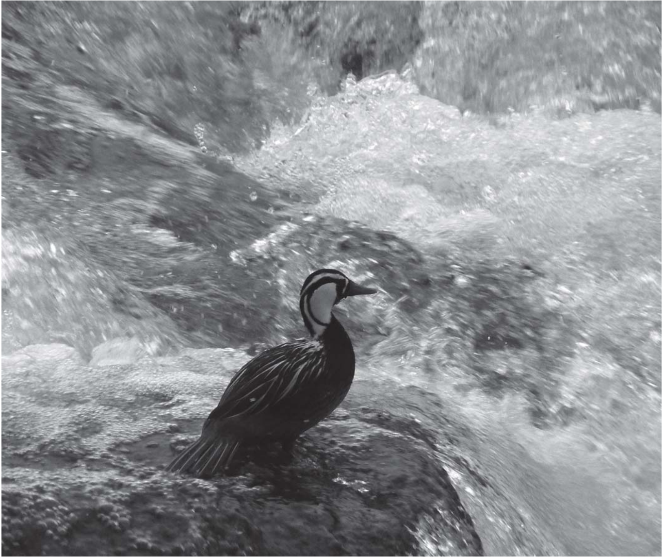
Imagen: Juan M. Karlanian

ca la decisión de aplicarla en el Parque Nacional Nahuel Huapi, donde los proyectos de conservación deben continuar a lo largo del tiempo y deben superar las vicisitudes presupuestarias teniendo en cuenta la complejidad que lo caracteriza, y al hecho que los recursos económicos y humanos deben ser administrados para abordar también a otras especies y sus problemáticas asociadas. En relación a los métodos que implican la captura de aves para la colocación de anillos u otros dispositivos, y si bien distintos investigadores sostienen que en el pato de los torrentes esta práctica no implicaría un riesgo para los individuos, se decidió utilizar la fotoidentificación como método no invasivo, debido a que tiene sentido y potencial en el marco de las metas y objetivos tendientes a la recuperación de sus poblaciones. También sería importante poder extrapolar esta experiencia a otras áreas protegidas donde habita esta especie a fin de compartir, analizar y discutir los alcances y resultados de su aplicación bajo distintas realidades de manejo. Por último es importante señalar que se trata además de una metodología que permite la participación de naturalis-