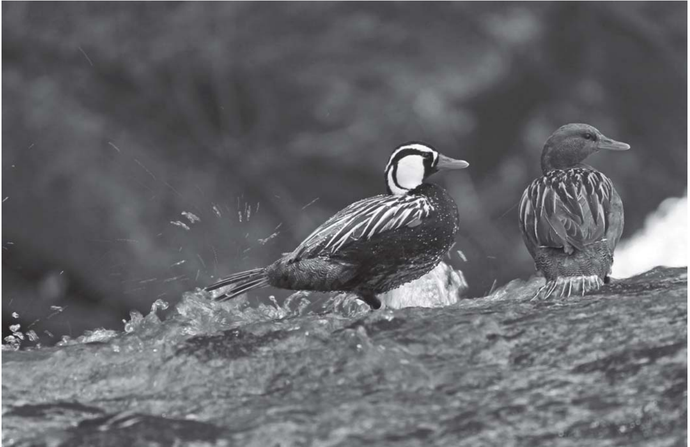
Imagen: D. Belmonte