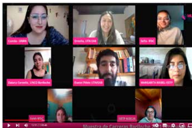
28 El fogón estudiantil, en sus modalidades presencial y virtual. De estudiantes para estudiantes, un espacio donde compartir vivencias, inquietudes, temores y consejos en relación a la vida universitaria.