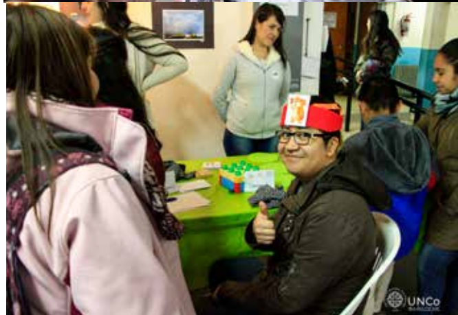
Estudiantes participando de las distintas propuestas de las muestras de carreras presenciales, en 2018 y 2019, realizadas en la sede bariloche de la Universidad Nacional del Comahue.