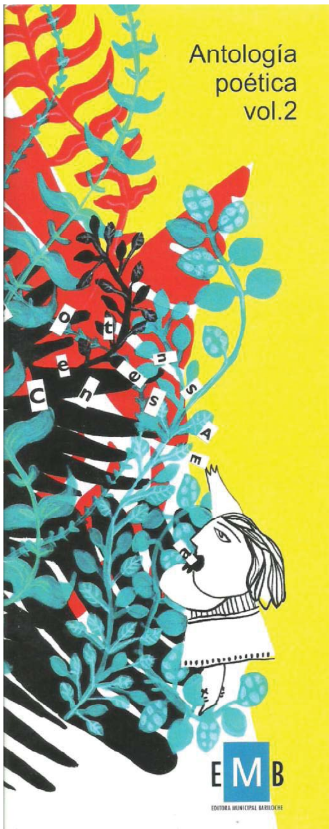
Tapa de la antología poética editada en 2015

escritores que tienen obras guardadas en los cajones, porque no se animan, no tienen los medios, o necesitan un estímulo.