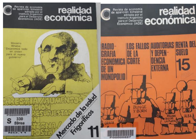
Imagen I. Portadas de RE del año 1972.

Fuente. RE . Tapa. Núm. 11, 1er Bimestre de 1972 y RE . Tapa. Núm. 15, 4to bimestre de 1972.