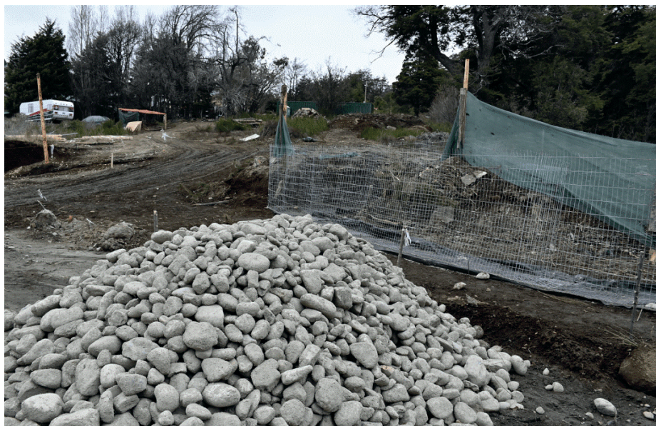
Imagen N° 4. Pérdida de Bosque Nativo - Zona Oeste.

Esta presión urbana en esta área sobrepasa la capacidad de gestión, aprobación y control por parte del municipio, que se agrava por la escasa coordinación entre los organismos que intervienen para su ocupación o