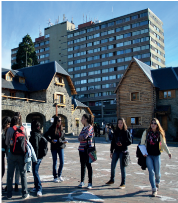
Imagen N° 6. Bariloche Center.