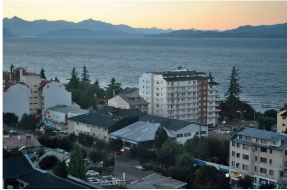
Imagen N° 7. Edificios en propiedad horizontal en costa de lago.