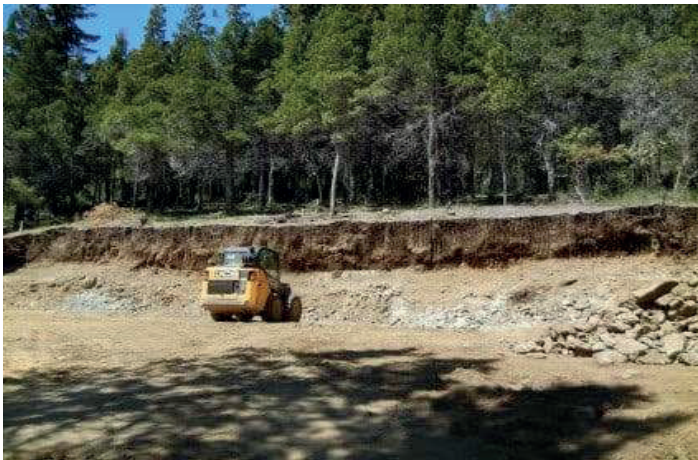
Imagen N° 5. Proyecto Cauma en Reserva Natural Urbana El Trébol.

En la deforestación de terrenos para obras a futuro, el Servicio Forestal Andino actúa cuando el proyecto a construir (vivienda, hotel o cualquier emprendimiento inmobiliario) está visado por el municipio. Con el plano de proyecto aprobado se verifica en el terreno y se marcan para su tala los árboles que causan riesgo sobre las edificaciones. El criterio que se aplica es el de autorizar la extracción de la menor cantidad posible de ejemplares, pero en