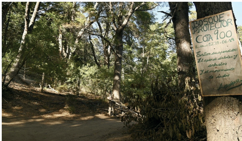
Imagen N° 2. Ladera del Cerro Otto.

En 1934, desde la gestión de la Dirección Nacional de Parques Nacionales, se comienza a visualizar al turismo como actividad económica principal. Se realizan inversiones en infraestructura en el casco urbano de la ciudad. Se comienza la construcción del centro cívico y la catedral. Se autorizan algunos fraccionamientos a particulares, hacia el oeste del casco central, sobre la costa del Lago Nahuel Huapi. La mayoría de los fraccionamientos y subdivisiones entre las décadas de 1940 y 1950 se realizan por este organismo. En la década de 1960 los loteos continúan ejecutándose, la mayoría de los fraccionamientos se concentran en el área central, en el área oeste, sobre la costa del lago Nahuel Huapi y Moreno y en sectores de topografía accidentada sobre las laderas de los cerros Otto y Runge.