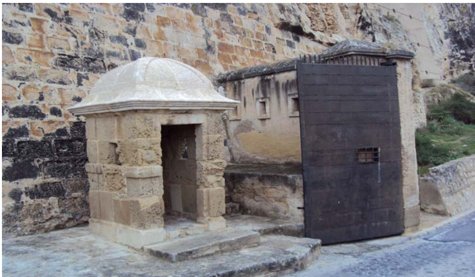
Imagen 3: Control acceso al Castillo.