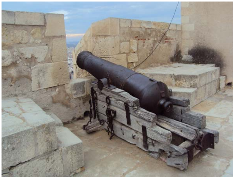
Imagen 9: Defensas del Castillo.