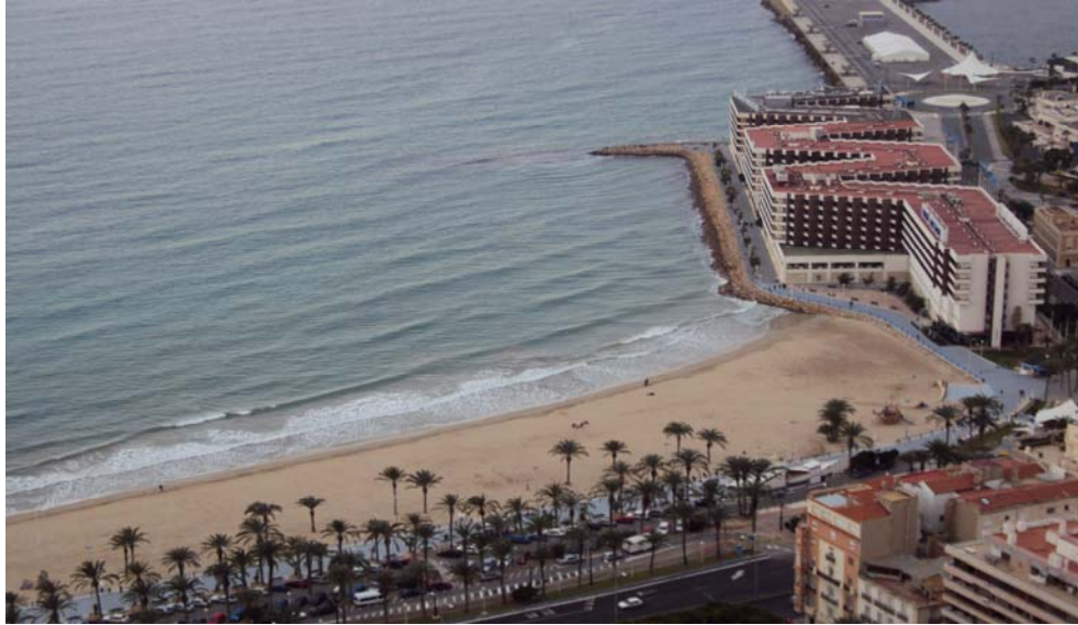
Imagen 6: Panorámica de la Playa del Postiguet desde el Castillo.