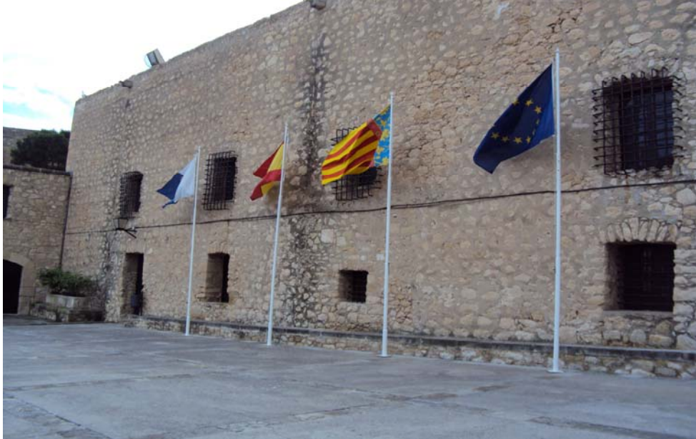
Imagen 4: Interior del Castillo. Plaza de Armas.