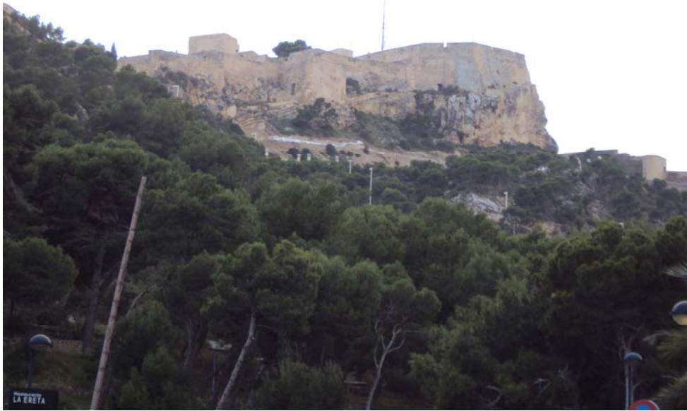
Imagen 2: Vista exterior del Castillo desde el Parque de La Ereta.