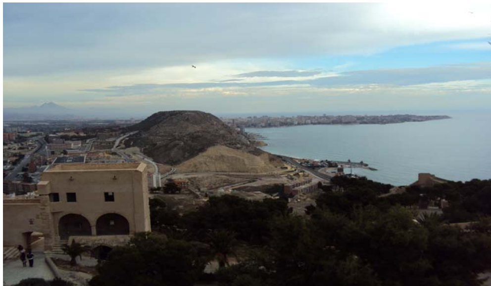
Imagen 7: Panorámica del Mar Mediterráneo desde el Castillo.