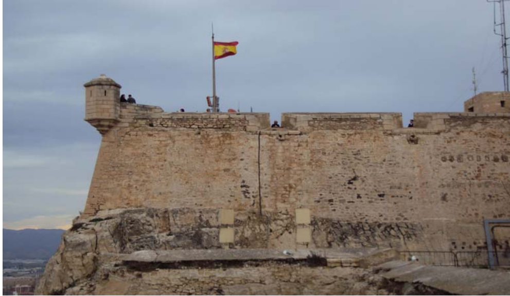
Imagen 8: Fortificación del Castillo.