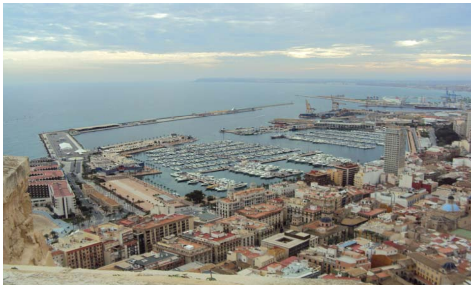
Imagen 5: Panorámica del Puerto y Casco Antiguo desde el Castillo.