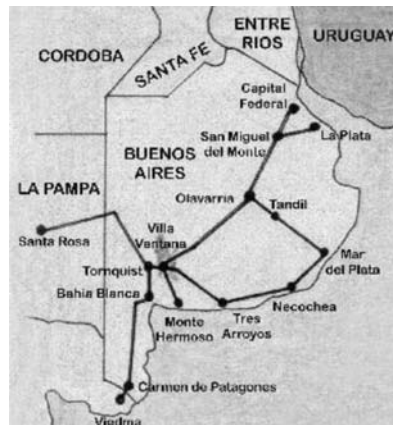
Figura 2: Localización y accesibilidad. Villa Ventana