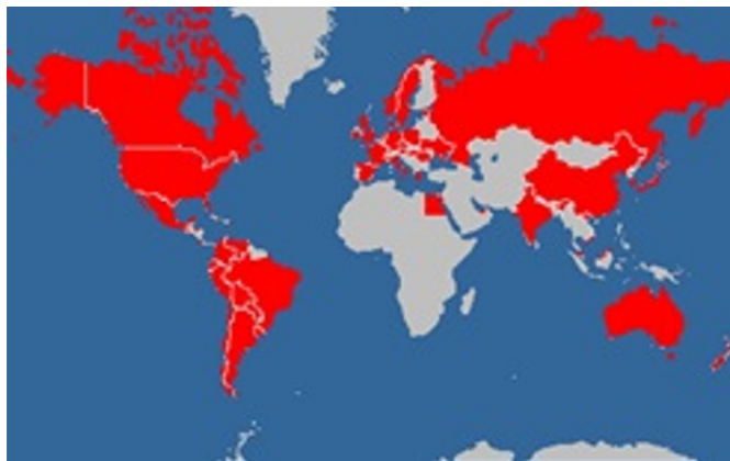
Figura 2: País de origen de visitantes al museo

Fuente: Elaboración propia en base al registro de visitas de extranjeros al Museo Ernesto Bachmann, empleando https://douwe.com/projects/visited?region=world