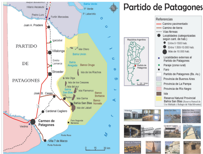
Figura 1. Conectividad del Partido de Patagones