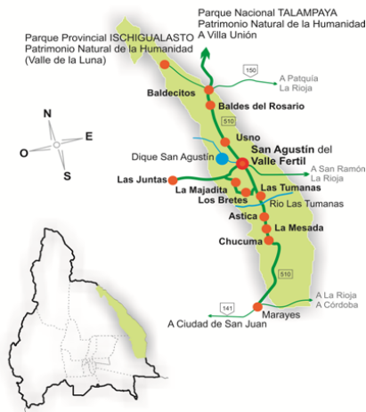
Departamento de VALLE FERTIL Provincia de SAN JUAN

Desde el punto de vista del Turismo propiamente dicho, es asegurar un mayor servicio en el trayecto San Juan – Ischigualasto; hacer más confiable la travesía a través del corredor; potenciar la competitividad de esta conexión frente a otras que parten desde otras provincias; generar en el turista una mayor confianza en la toma de decisión en el momento de elegir un destino como es el caso de Ischigualasto que se encuentra a una gran distancia de los centros urbanos y que en el trayecto se caracteriza por ser muy inhóspitos y de gran desolación, aunque en dichas comunidades pueden encontrar respuestas a parte de sus demandas en el recorrido como se expresa más adelante.