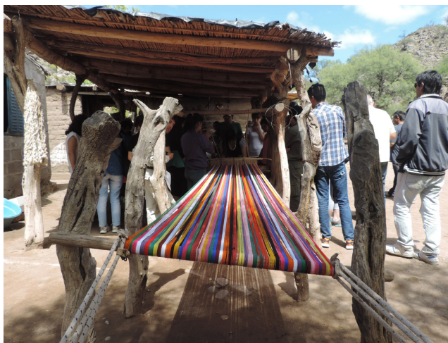
Imagen N° 3. Trabajo al telar - Paraje "La Majadita".