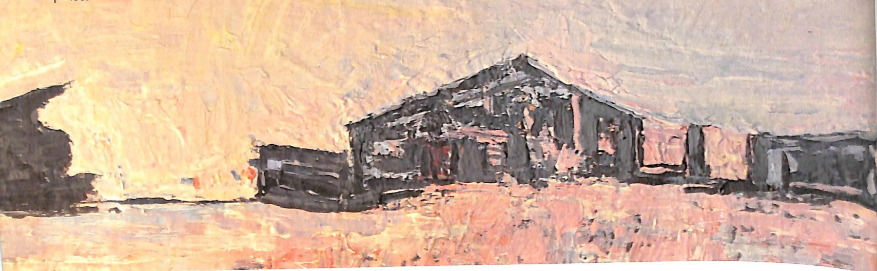
CALÁ LESINA; ÓLEO SOBRE MADERA, 1997

tos, hablan sus protagonistas y se producen conversaciones sobre las coincidencias y divergencias de sus marcos referenciales y sus prácticas.