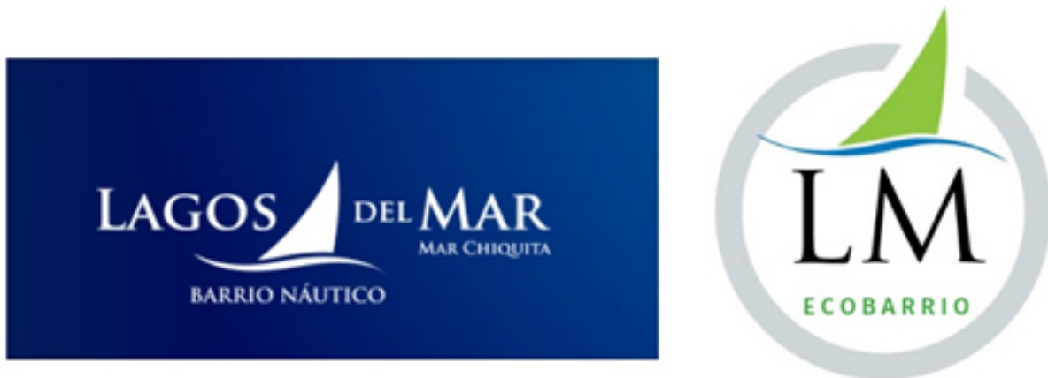
Figura 3. Logotipos del proyecto Lagos del Mar

la naturaleza en sintonía con el círculo, brindando una sensación de armonía con el entorno. Del nombre del proyecto solo se mantienen las iniciales. Esta decisión implica una actitud diferenciadora respecto al pasado, y las siglas permiten que sea el consumidor quien “complete” el significado de las mismas. Tal como señala Wilensky (1998) las siglas operan como palabras nuevas que pierden generalidad. De este modo, hay una intención de que los significados reales sean desconocidos u olvidados.