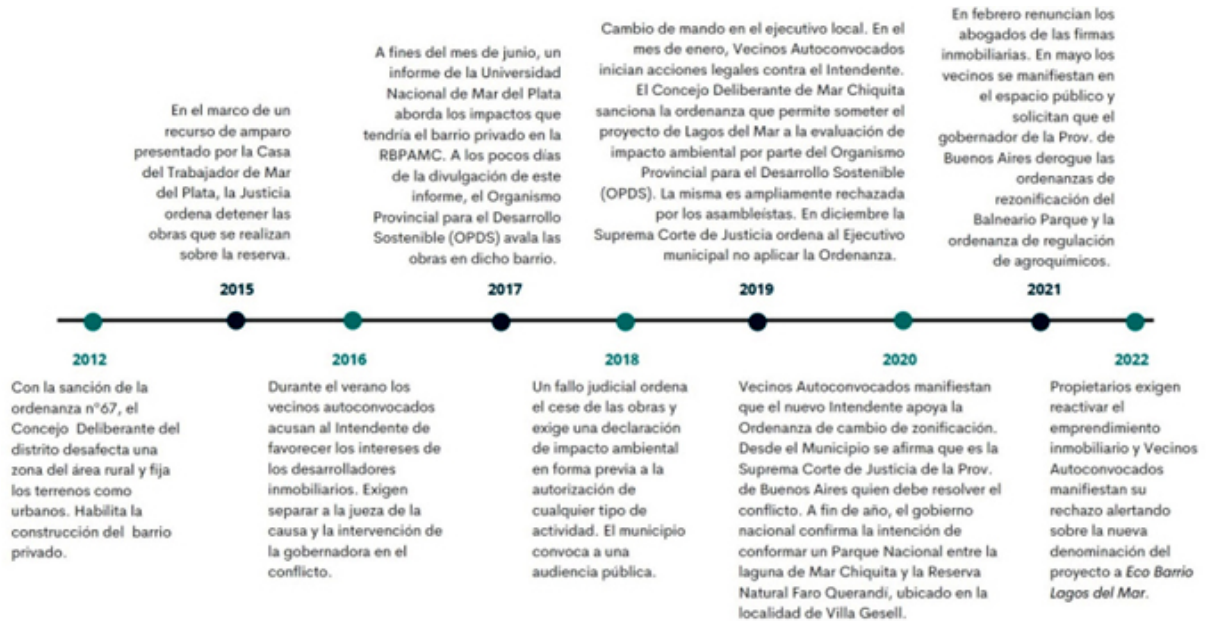
Figura 2. Puntos principales del conflicto "Lagos del Mar".