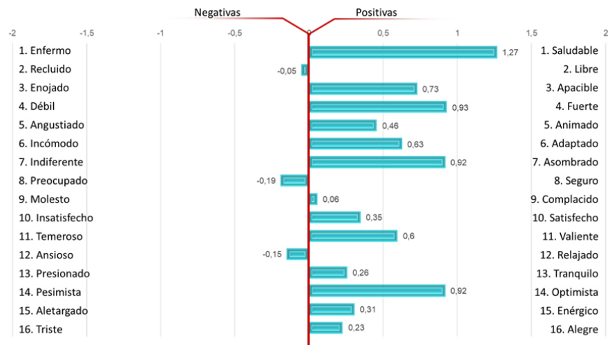
Gráfico 4: Estado de ánimo de los participantes respecto de la pandemia