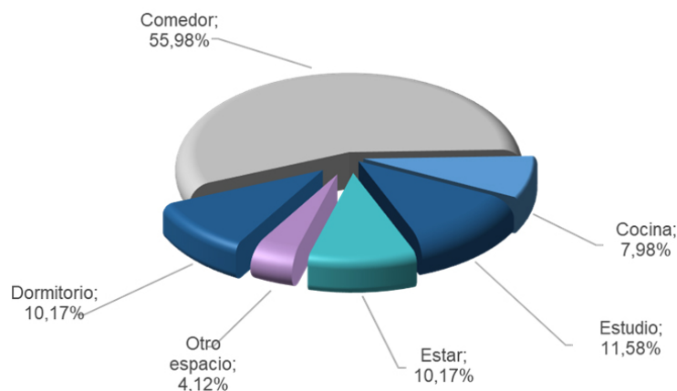
Gráfico 2: Distribución de los participantes según espacio físico de trabajo