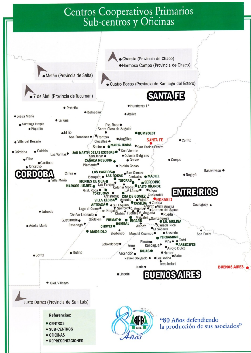
Imagen 1. AFA. Centros Primarios Cooperativos, Subcentros y Oficinas