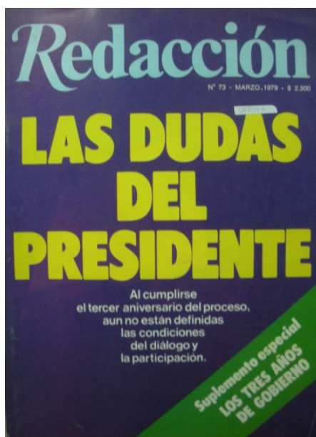
Tapa de Redacción de marzo de 1979, al cumplirse el tercer aniversario del inicio de la dictadura

Redacción , como lo venía haciendo desde el golpe de 1976, presentaba a Videla como una suerte de “garante” de la democracia futura, que parecía tener que lidiar con los sectores internos de las FF.AA que no estaban interesados en prontas salidas u aperturas políticas. Pero también lo ubicaba en una posición ambigua, ya que pese a sus declaraciones de “fe democrática” lo que persistían eran las dudas en relación a una convocatoria concreta a los dirigentes políticos. Esas dudas demostrarían tener su asidero: hacia 1979 Videla se había quedado “sin juego propio” en casi todos los ámbitos de poder, y el apoyo a Martínez de Hoz se tornó su proyecto exclusivo y el único que le podría proveer mayor sustentabilidad (Novaro y Palermo 2003). En efecto, contrariando las resistencias de un variado arco opositor, que incluía a empresarios ligados al mercado interno y al agro, sectores de las FF.AA, los sindicatos, los partidos tradicionales y la Iglesia, entre otros, en diciembre de 1978 el ministro de Economía profundizará la apertura comercial y la liberación del mercado de capitales que se venía aplicando desde 1977.