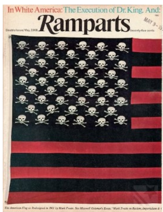
Tapa de la revista Ramparts , que inspiró el logo de Redacción

La revista estaba destinada a sectores profesionales, empresarios y dirigentes en general. Según Gambini: "Apuntábamos a la clase media. Son los compradores de libros y son los que compran este tipo de publicación" 7 . Se presentaba como un exponente del periodismo de interpretación, destinada a un lector informado a través de otros medios pero que necesitaba comprender más profundamente los temas de actualidad nacional, como también acceder a información sobre temas culturales, históricos y económicos.