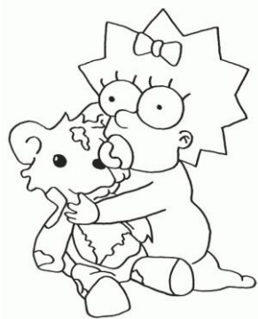
Maggie está abrazando a su osito

1. Si mirás esta imagen, vas a ver que Maggie está abrazando a su osito.